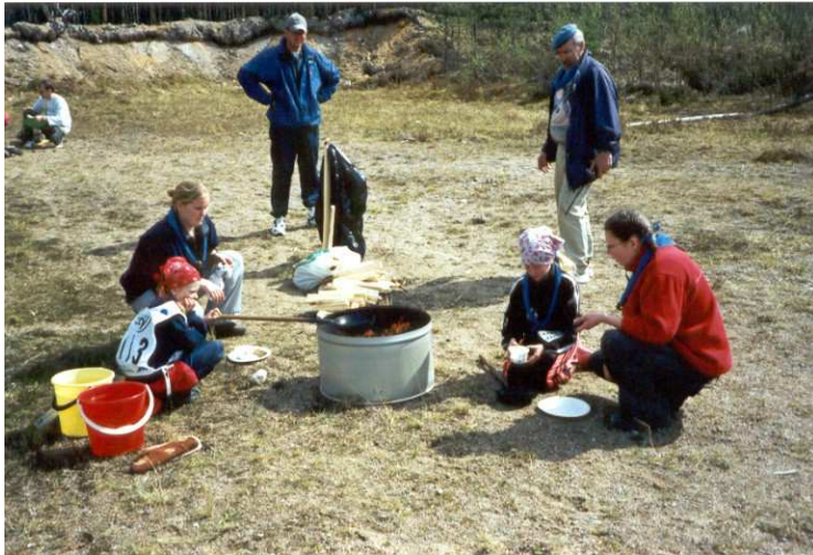
Letturastilla riitti rastihenkilöillä valvottavaa. Laulurastilla piti tehdä uusi sanoitus lauluun.