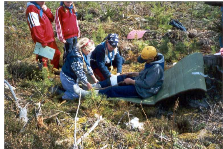
Ensiapurastilla on hoidettava nilkan nyrjähdys.

olivat vaikeusasteeltaan kohdennettuja juuri sudenpennuille. Suunnistusta reittiin ei sisältynyt vaan reitti oli kokonaisuudessaan merkitty puihin kiinnitetyillä keltaisilla nauhoilla. Kisan viestiliikenne hoidettiin metsästäjiltä lainatuilla radiopuhelimilla, joista olikin korvaamatonta apua kisan aikana. Kisatoimisto ja tuloslaskenta sijaitsivat leirikeskuksen toimistohuoneessa, johon oli sijoitettuna kaksi tietokonetta tulostimeen. Tuloslaskenta toimi kisan aikana hyvin ja tuloksia tippui tasaiseen tahtiin ilmoitustaululle.